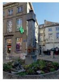
02 AOUT Balade historique Centre-Ville