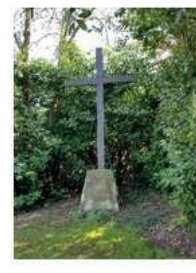
04 OCTOBRE Sur les traces de la 2 ème GM