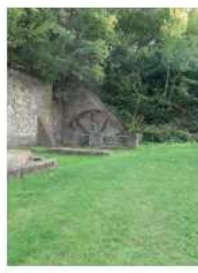
07 JUIN Promenade des Marchaux