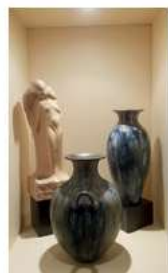
05 AVRIL Maison de la Poterie

► Sabine Ancia , Échevin des Bibliothèques