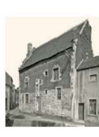
06 SEPTEMBRE Sur les traces de la 1 ère GM