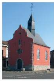
05 JUILLET Chapelle Saint Roch