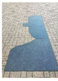
03 MAI Promenade Magritte