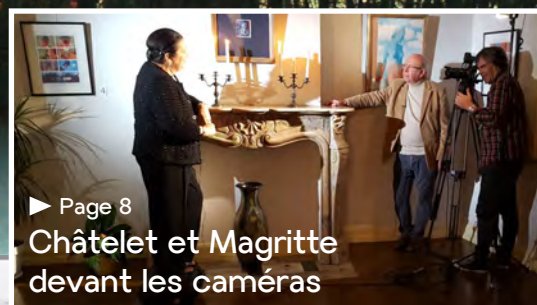
► Page 8 Châtelet et Magritte devant les caméras

EDITEUR RESPONSABLE : Le Collège Communal 55, Rue Gendebien - 6200 Châtelet