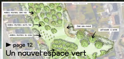
► page 12 Un nouvel espace vert