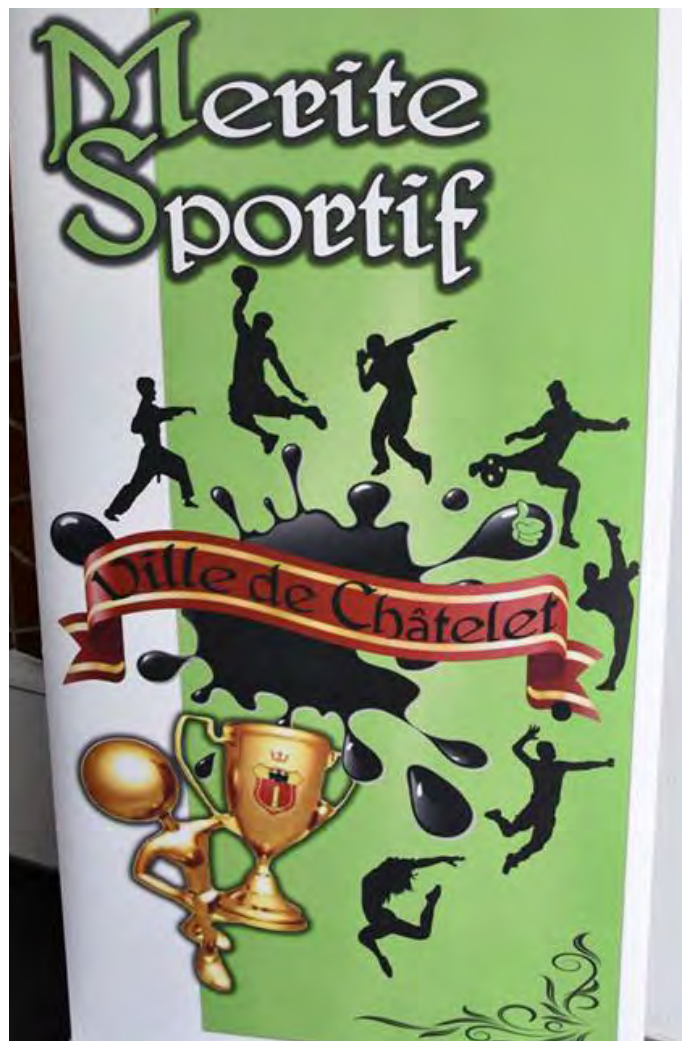
► Alpaslan Beklevic, Echevin des Sports

Le Prix spécial de la Commission est un prix "coup de cœur" qui peut être retenu parmi les candidatures déposées ou être proposé par un membre de la commission ayant connaissance d'une performance sportive particulière (par exemple, une action sportive solidaire, une performance sportive d'un citoyen moins valide,...).