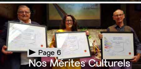
► Page 6 Nos Mérites Culturels